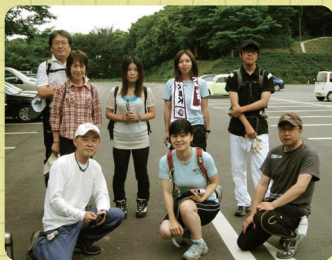
スタート前!! 眠いです Zzz...

7/12(日)に、ラクーンの第1回イベント～筑波山トレイルラン&ウォーキング～に行ってきました!! 梅雨時にも関わらず、いいお天気でした。今回の参加メンバーは、会員さん・スタッフの総勢9名でした。