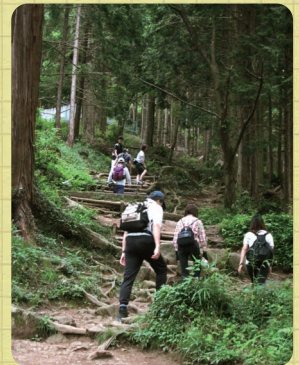
まだ、このへんではみんな余裕で、ワイワイおしゃべりしながら登ってます☆