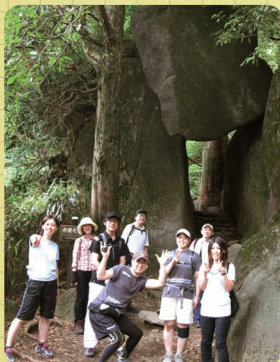
弁慶の岩の前にて。 でっかい岩が落ちてきそうでめっちゃこわい～!!

足場が悪い場合もありますので、シューズは、ソール部分がしっかりしたタイプをご用意下さい。写真は7月9日、また梅雨中に試登山した時の写真です。 3回も尻餅をついてしまった私。