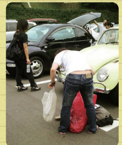
ゴールした後は腹ペコなので、ごはんが最高に美味しいです!!