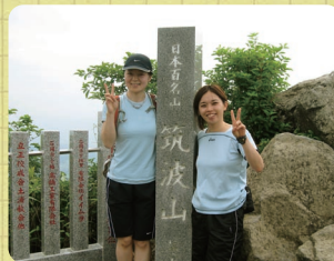
頂上まできた証です。