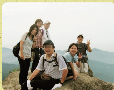
頂上に着きました!!

途中で元気なおじいさんに出会いました。このおじいさんも8歳ですが、なんと筑波山に登るのは401回目だそうです!!! 自慢のふくらはぎはムキムキでした!